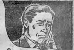
Cuando la Piorra