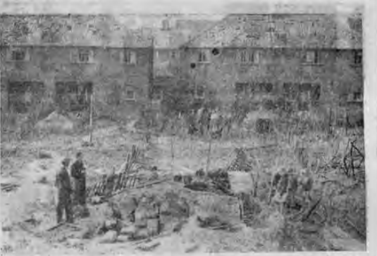
Cerca del aeródromo de Croydon en las afueras de Londres, han caído las bombas alemanas y esta vista fue tomada en los primeros días del corriente mes...

Un dolor de cabeza? Una Pastilla Oriental! This is a handwritten-style advertisement for 'Pastilla Oriental' medicine, written in a cursive script over the page.