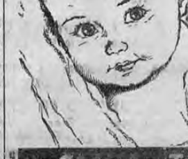
CREMA DE TRIGO (Cream of Wheat)

"¿Qué hermoso niño!" Así exclaman las mujeres cuando ven a un niño como este, agregando, "¡y qué bueno!"